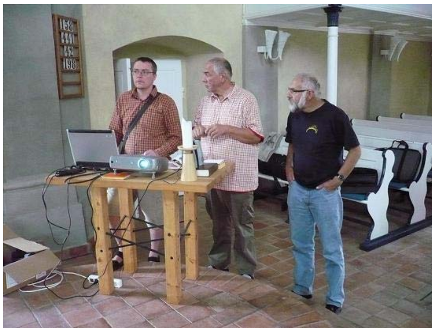
Příprava prezentace aktivit sdružení v Rumburku, v kavárničce Na kopečku.

Děkujeme Vám i všem ostatním, kteří jste jakkoli podpořili činnost občanského sdružení Consonare.