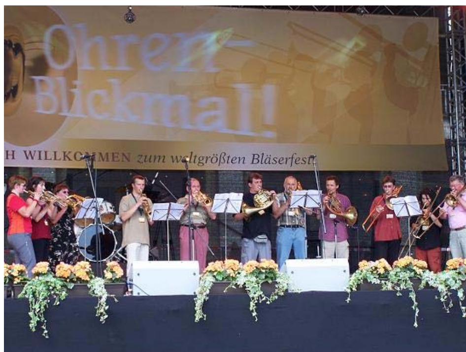
Vystoupení Consonare na Posaumentag Leipzig 2008.

Kdyby se mě někdo zeptal, zda jsem s rokem 2008 spokojen, řekl bych ano, ale... byl bych rád, aby se nám podařilo alespoň udržet nastavený kurs a přispět k šíření myšlenek Consonare dál. Ale o tom zase někdy jindy a někde jinde.