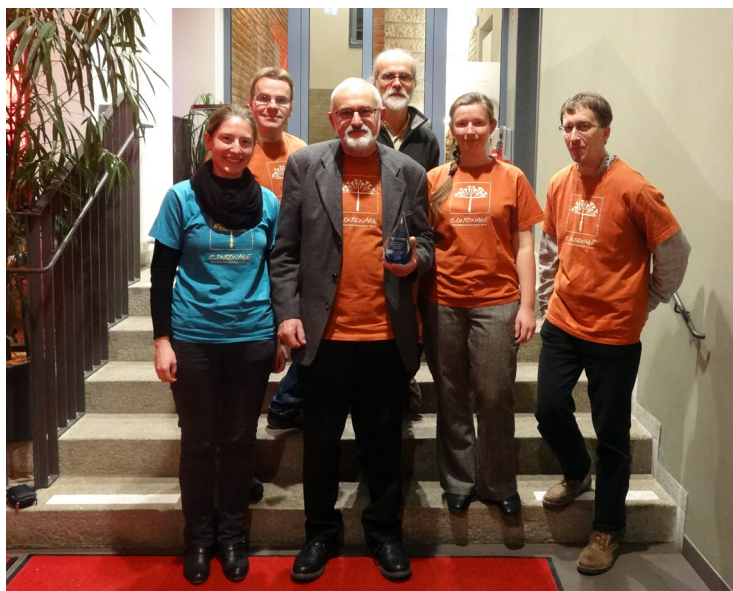
Bautzen Dezember 2017