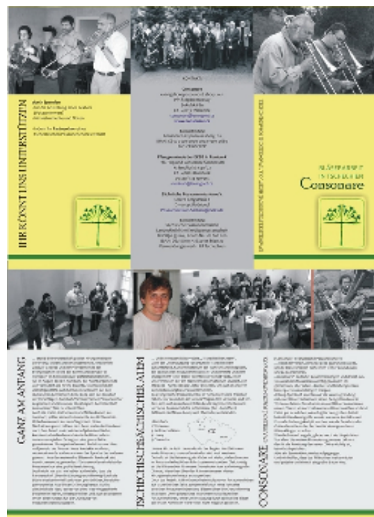
Presentační materiál Consonare v německém jazyce.