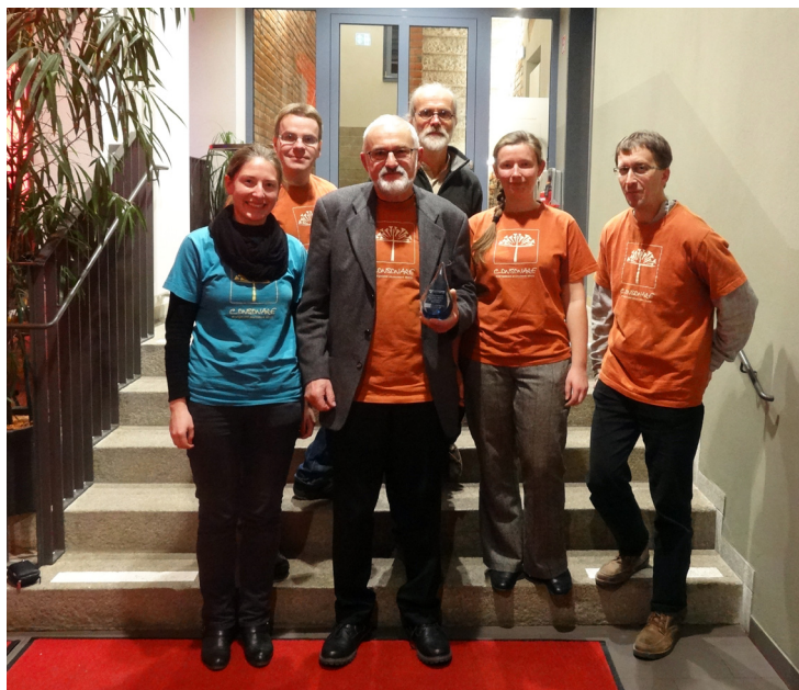
Ze slavnosti v Budyšíně (prosinec 2017)